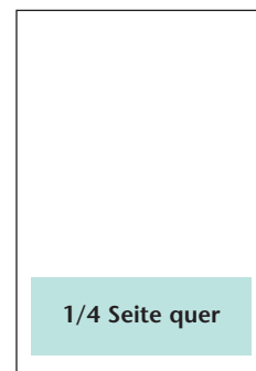
Breite: 183 mm Höhe: 60 mm