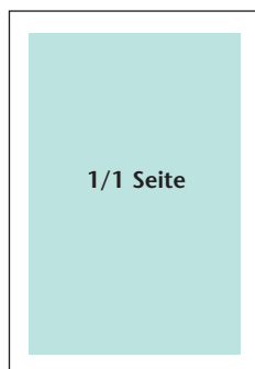
Breite: 183 mm Höhe: 263 mm

Bei Änderung der Anzeigenpreise treten die neuen Bedingungen auch bei laufenden Aufträgen sofort in Kraft, sofern nicht ausdrücklich eine andere Vereinbarung getroffen wurde.