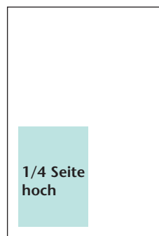
Breite: 90 mm Höhe: 130 mm